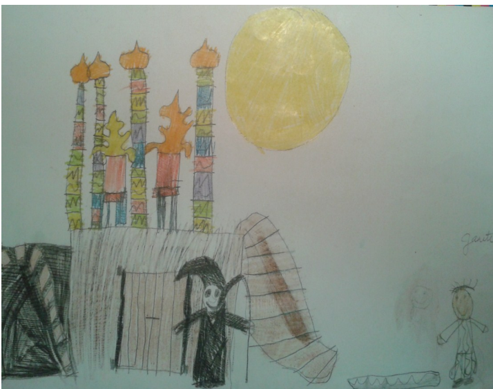
Pildi joonistanud Janete Pähn 2. klass

“Mulle meeldis see, et me olime nii suures saalis ja laval oli palju näitlejaid” Janete