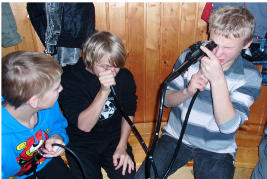
Fotol 7. klassi poisid

Kokkuvõttes meeldis õppepäev kõigile, ka neile, kes seal enne käinud oli, kuna seekord nägime asju, mida eelmisel korral ei näinud.