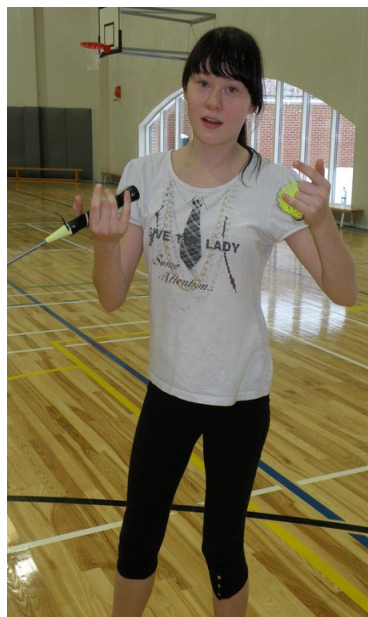
Fotol Merilin Päiviste

Pilte turniirist leiad Janari fotoalbumist aadressil: http://fotoalbum.ee/photos/JanarKiik/sets/1337737