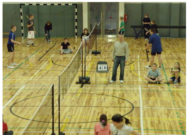
Foto tehtud sulgpalliturniiril