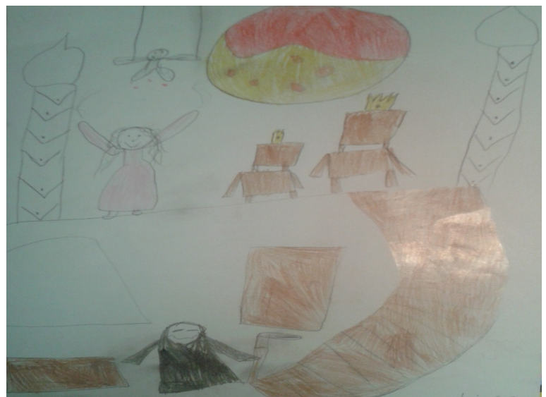
Pildi joonistanud Mirtel Puna 2. klass