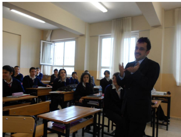
Fotol Aliaga Liesi keskkooli 9. klass inglise keele tunnis.