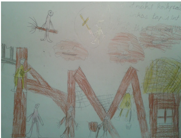
Pildi joonistanud Brayen Armando Kaljula 2. klass