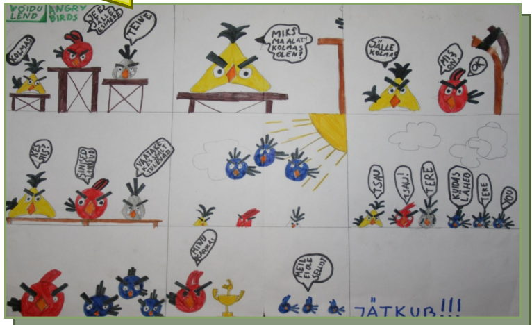
Angry Birds "Võidu lend" Reimo Hunt (4. klass)