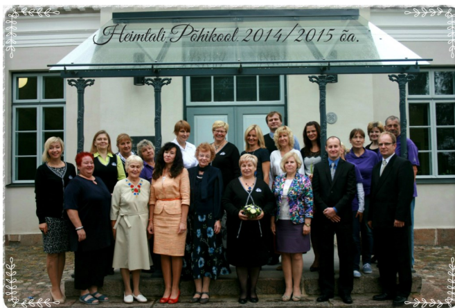
Heimtali Põhikooli koolipere soovib ilusat sügisvaheaga!

Olete oodatud lastevanemate üldkoos-olekule, mis toimub 5. novembril algu-sega kell 17:30 Heimtali Põhikooli mõi-samajas. Lisaks õppekasvatustööga seotud teemadele on vajadus valida uusi lastevanemate esindajaid kooli hoolekogusse. Iga lapse vanemate osa-võtt on oluline! Võimalus kohtuda klas-sijuhatajate ja aineõpetajatega.