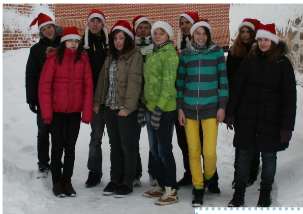
Fotol 9. klassi päkapikud

jõuluõhtu. Kambakesi meisterdati uhkeid jõulukaarte ning tehti maitsvaid piparkooke, mille pärast värviliselt ära kaunistasime. /Moonika Viibur 9. klass/