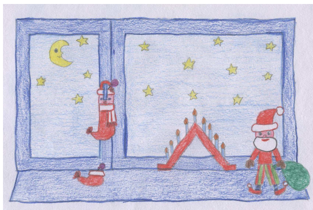
Joonistuse autor Anete Leiman 1. klass