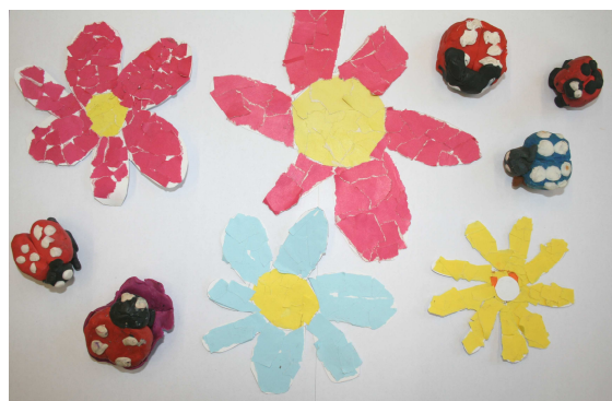
Fotol 1. klassi õpilaste lilled ja lepatriinud