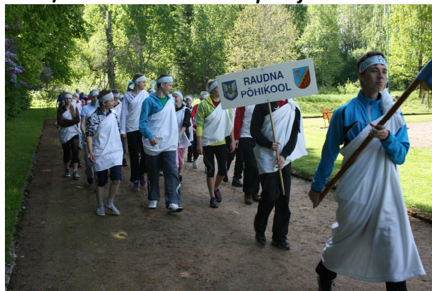
Raudna Põhikooli parimad sportlased Puiatus Antiik-olümpiamängudel