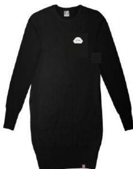
Tüdrukute dzemperkleit VICOL 25 Värvus: must Suurused: 116-164 Materjal: 80% puuvill, 20% polüester Neidude ja naiste dzemperkleit VICOL Suurused: XS-XXL Hind: 34.00 eur