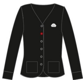
Neidude / naiste kardigan VERO 42 Üks nööp punane Suurused: 146-188 Materjal: 50% peen meriino vill, 50% polüakrüül Hind: 48.00 eur