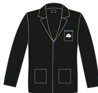
Noormeeste / meeste kootud pintsak ANDERO Nööbide randi värvus erksinine Suurused: S - XXL Materjal: 50% peen meriino vill, 50% polüakrüül Hind: 48.00 eur