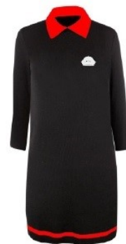
Neidude kleit SIZI Värvus: must punase krae ja triibuga Suurused: 146-188 Materjal: 50% viskoos, 50% polüakrüül Hind: 38.00 eur