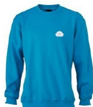
Noorte ja õpetajate pusa JN040 Suurused: S-3XL Värvus: türkiis, punane, must Materjal: 80% puuvill, 20% polüester, 300 g/m2 Hind koos kooli logoga: 21.00 eur