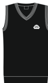
Noormeeste/meeste vest VIO 01 Suurused: 170-188 Materjal: 50% peen meriino vill, 50% polüakrüül Hind: 37,00 EUR