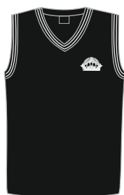
Laste vest VIO 01 Suurused: 116-164 Materjal: 50% peen meriino vill, 50% polüakrüül Hind: 30,00 EUR

Ühtne koolivorm rõhutab õpilaste olulisust ja koolipere ühtekuuluvustunnet. Heimtali Põhikooli koolivorm on inspireeritud kooli sümbolikast. Musta põhivärvusega kudumeid ilmestavad valged triibud ja kooli logo tikand.