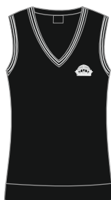
Neidude/naiste vest VIO 41 Suurused: 170-188 Materjal: 50% peen meriino vill, 50% polüakrüül Hind: 37,00 EUR